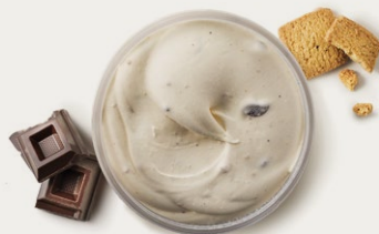
48691 CREMA DI GROM