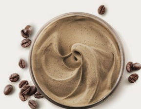
48691 CAFFÈ ESPRESSO